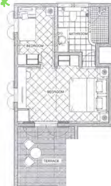
CONFORT - FAMILLE