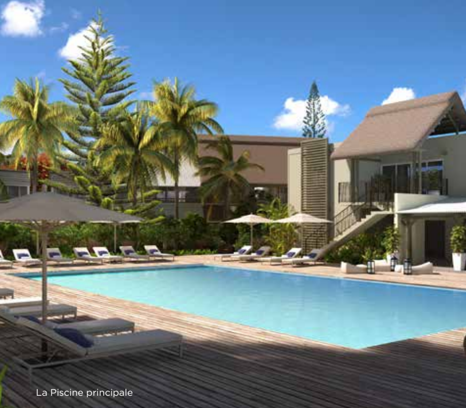
La Piscine principale